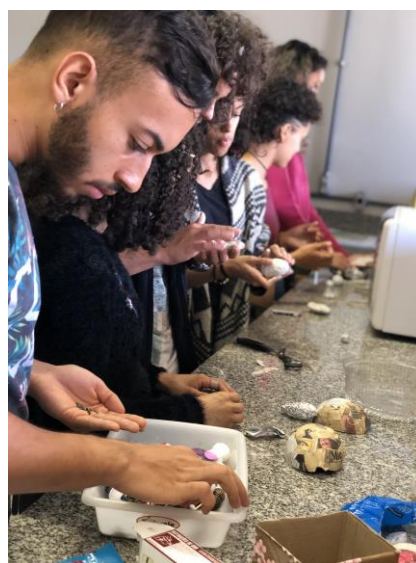
Produção dos modelos didáticos desenvolvidos pelos Pibidianos

Durante as atividades os Pibidianos puderam compreender melhor como são feitos e planejados os modelos didáticos a serem utilizados em sala de aula bem como tiveram a oportunidade de desenvolver seu próprio modelo.