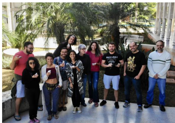
Pibidianos do Subprojeto Multidisciplinar Ciências Naturais com os modelos desenvolvidos